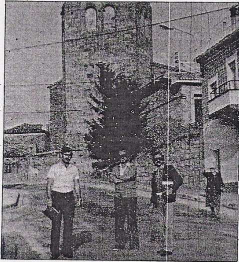
Castrillo: camino hacia la sierra.