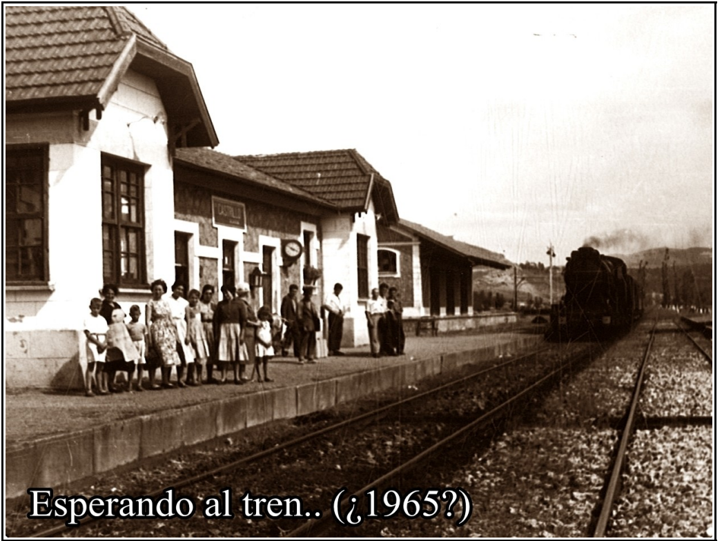
Esperando al tren.. (¿1965?)