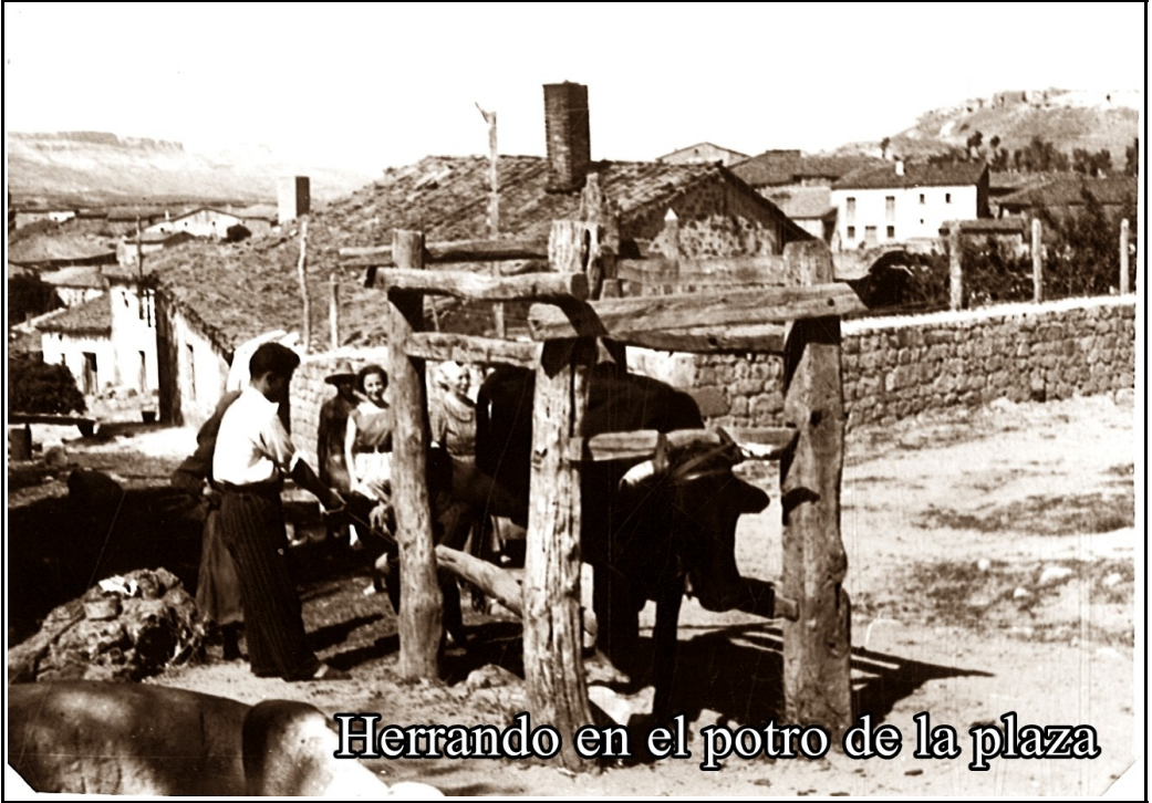
Herrando en el potro de la plaza