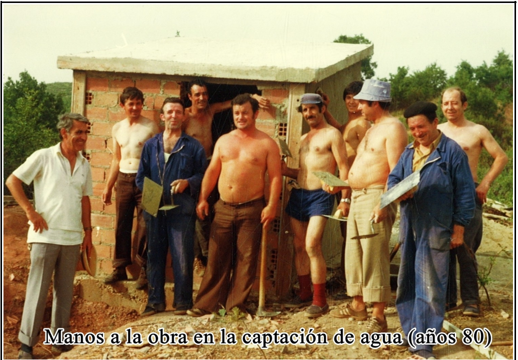
Manos a la obra en la captación de agua (años 80)