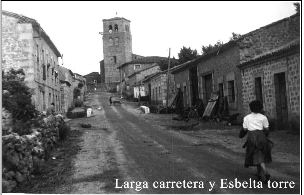
Larga carretera y Esbelta torre